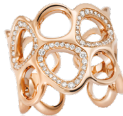
■ SCHEFFEL Armreif und Ring „Loop“ aus Rotgold 750 mit Brillanten