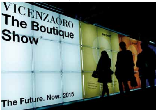
Oben: Willkommen zur Vicenzaoro! Rechts: Ring von Aris (Istanbul)