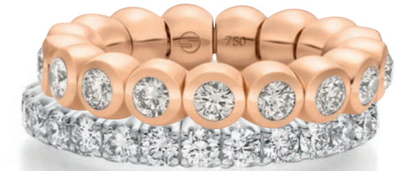
Ringe mit dehnbaren Elementen passen sich den Fingern perfekt an.